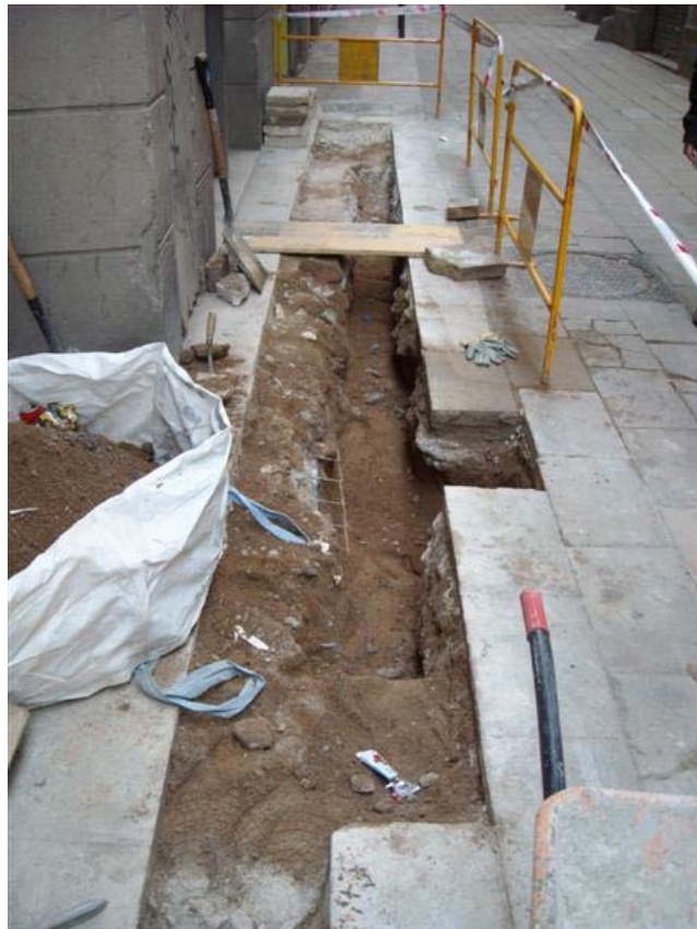
Vista general del tram de rasa situat al carrer dels Assaonadors

Amb aquestes dades, hem de dir que el resultat de l'excavació de les rases i del pou de registre va ser negatiu quant a la documentació d'estructures i estrats arqueològics de rellevància.