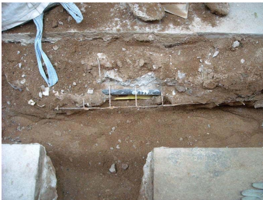
Detall de l'interior de la rasa situada al carrer dels Assaonadors